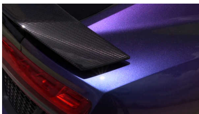
Still uit het videodrieluik van Koehorst en In 't Veld, dat het gebruik van mica in autolak en cosmetica aanklaagt.

Naast schoonheid en gebruiksgemak is nu ook maatschappijverbetering een doel van design, zo is in Boijmans te zien. En, levert dat wat op?